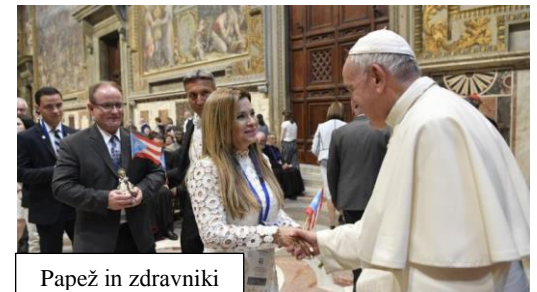
Papež in zdravniki

Za Jezusa zdraviti pomeni približati se osebi , čeprav bi mu nekateri včasih to hoteli preprečiti, kakor v primeru slepega Bartimaja v Jerihi. Jezus ga pokliče in ga vpraša: » Kaj hočeš, da ti storim? « (Mr 10,51) Lahko nas preseneti, da 'zdravnik'