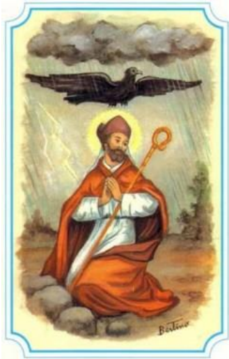
Š. Medardo v. 8 GIUGNO

Gotovo ste že slišali tisti pregovor, ki pravi: »Kakršno vreme Medarda kane, takšno štirideset dni ostane.« Sveti Medard, ki danes goduje, z vremenom nima nič opraviti v pregovor je prišel zato, ker so dolgoletne izkušnje kmečkih ljudi pokazale, da se prve dni junija vreme rado za dalj časa ustali lepo ali grdo. Če je vreme lepo, se začnajo pripravljati na košnjo. Življenje tega svetniškega moža, ki je bil rojen na severu Francije leta 457, sta popisala latinska pisatelja Venancij Fortunat in sv. Gregor iz Toursa. V svoja zapisa sta natresla precej ljubkih legend. Ena od teh pripoveduje, kako je nekdo prišel v njegov vinograd grozdje krast. Veliko si ga je naložil, ko pa je hotel