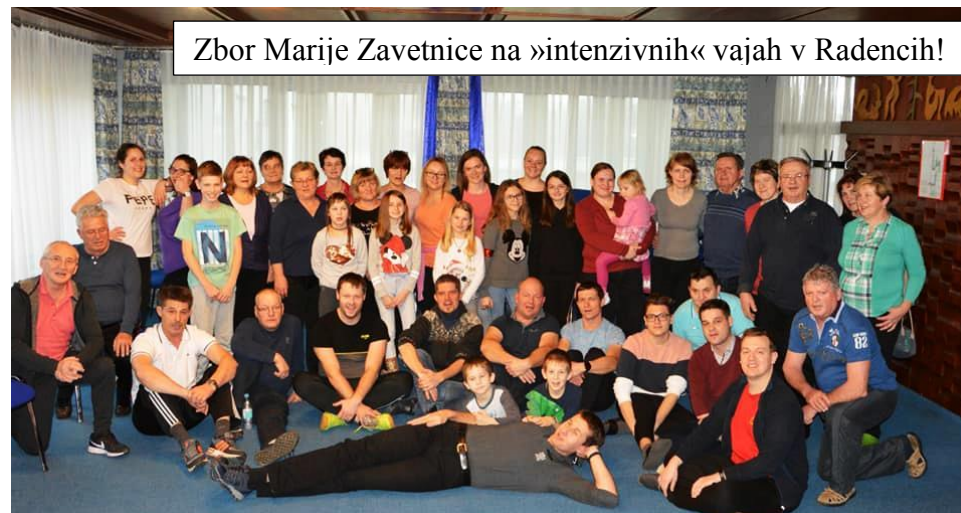
Zbor Marije Zavetnice na »intenzivnih« vajah v Radencih!

Papež Frančišek: Danes se teži k upočasnitvi zmanjšanja skrajne revščine in povečanju koncentracije bogastva v rokah le nekaterih. Malo jih ima preveč in preveč jih ima malo. Mnogi nimajo hrane in se prepustijo usodi, medtem ko se jih malo utaplja v preobilju. Ta pokvarjen tok neenakosti je uničujoč za prihodnost človeštva. Vsi smo od Boga ljubljeni bratje in sestre. Ob zatonu življenja bomo sojeni po ljubezni, po tem, kako smo ljubili. Ne samo čustvena ljubezen, ampak sočutna in konkretna, v skladu z evangeljskim pravilom: 'Kar koli ste storili enemu od teh mojih najmanjših bratov, ste meni storili' (Mt 25,40).«.