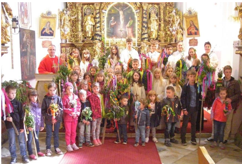
Prihovški otroci na cvetno nedeljo 2017